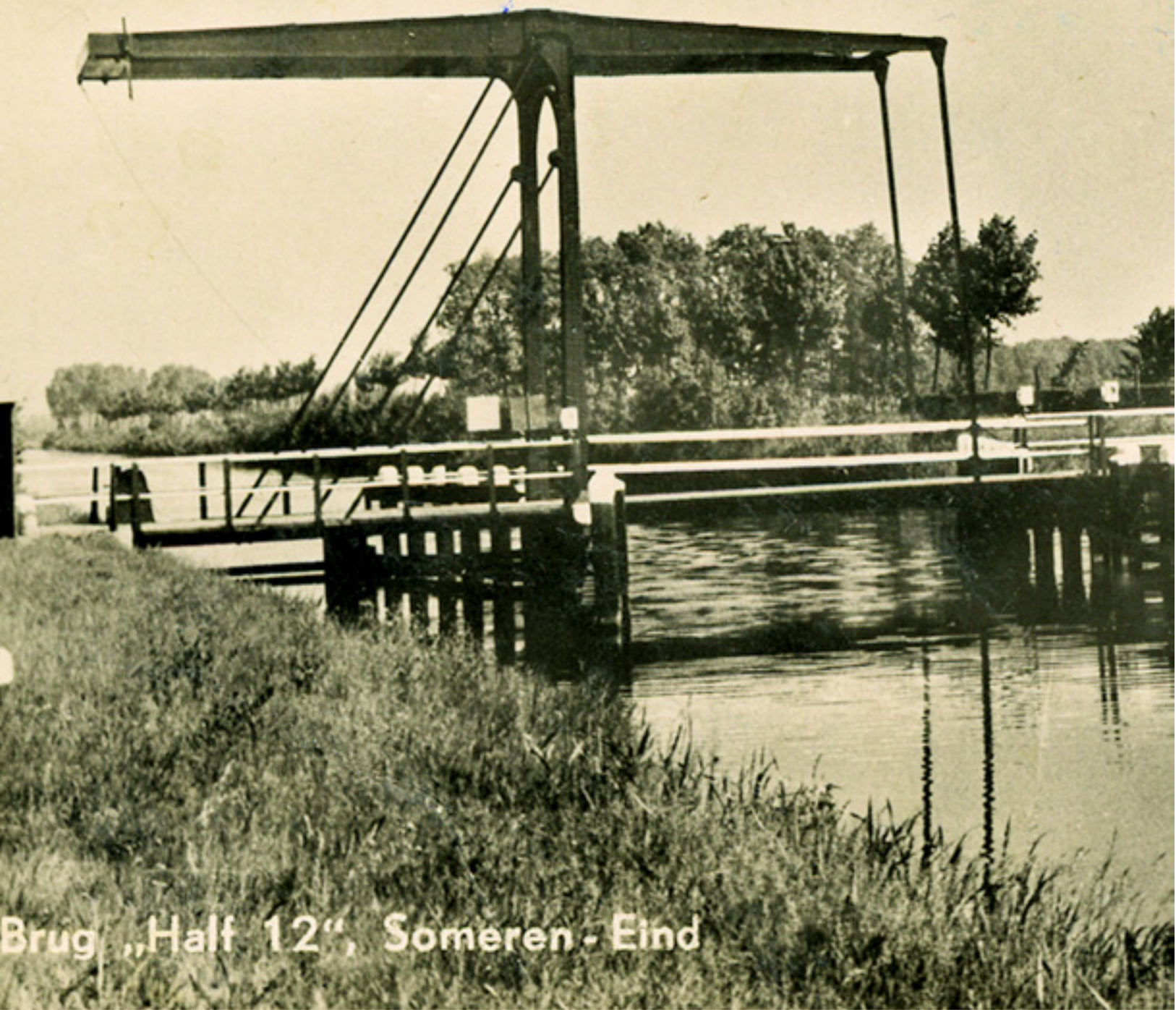
Brug „Half 12“, Someren - Eind