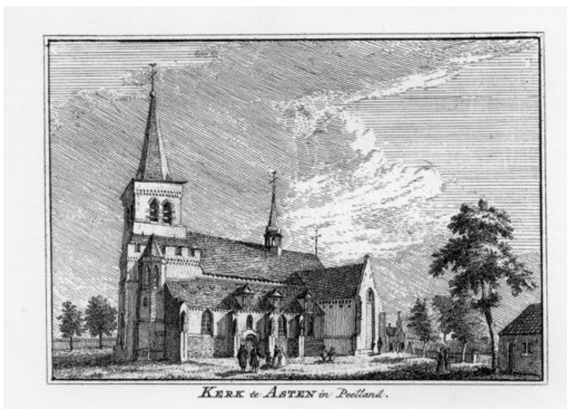
Kopergravure van Hendrik Spilman anno 1738, gebaseerd op een tekening uit 1685 van de kerk in Asten.

een honorarium. Maar als men afwezig was en een vervanger nodig had, betaalde men een boete.