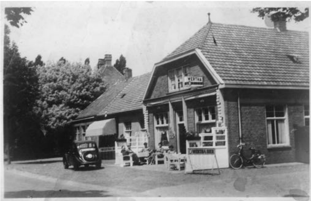
Hotel Centraal, Someren, 1950