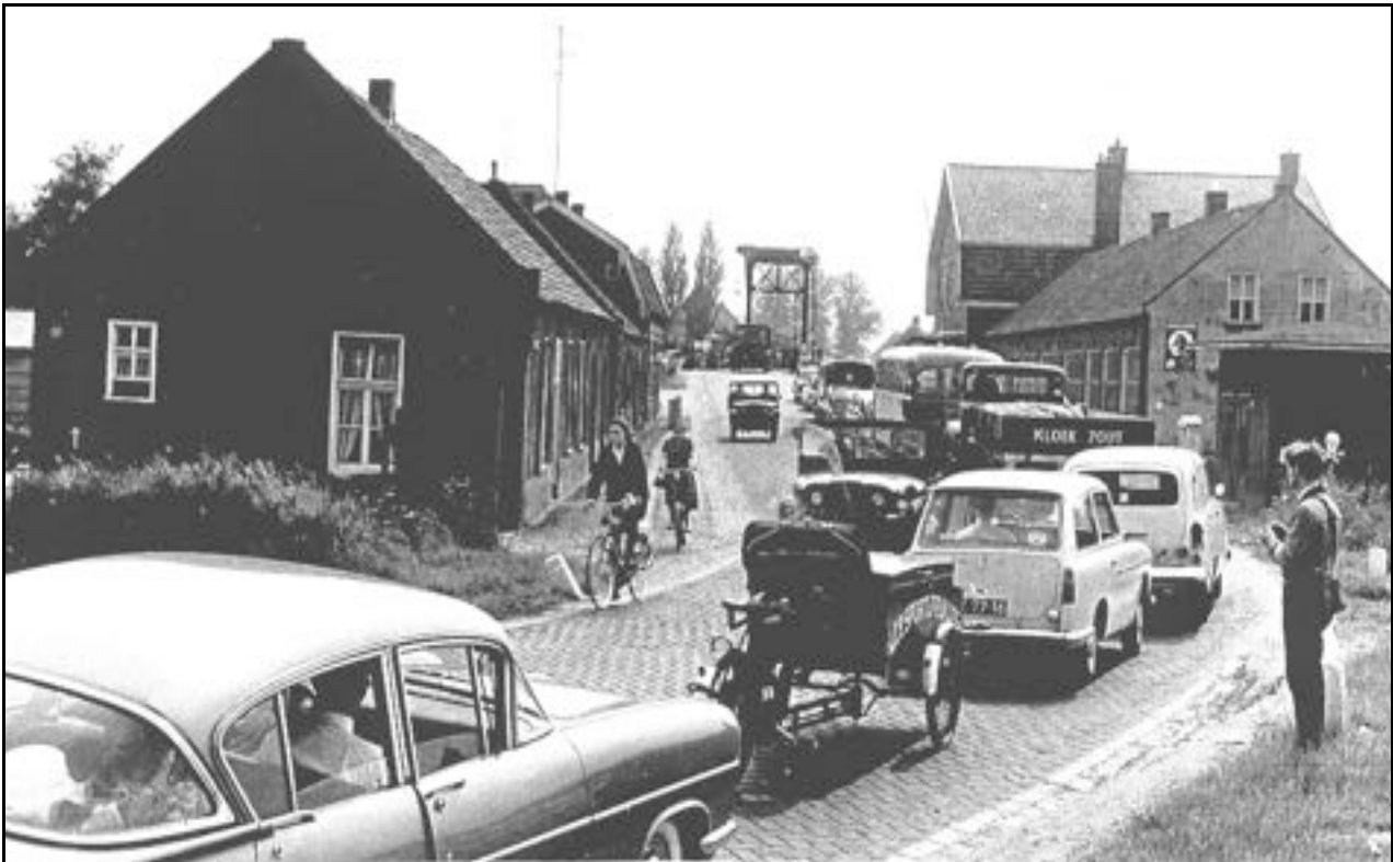
Wachten, richting Someren, voor de ophaalbrug van sluis 11. Vooraan links café Gehem-van Poppel, rechts café Lammers.