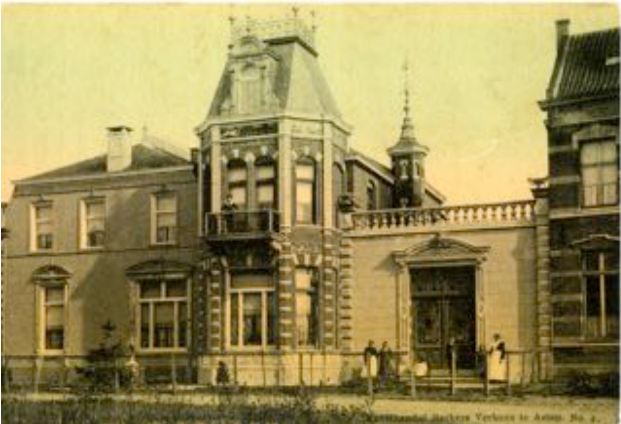
Villa Bluijssen Asten, 1906