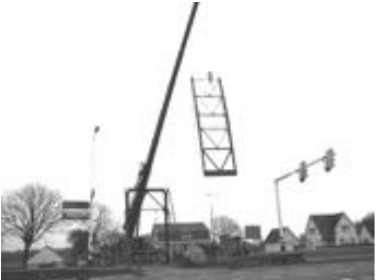
Ophaalbrug Sluis 12 wordt opgehaald – 3 februari 2009

Natuurlijk is het een verbetering om ongestoord via een ‘hoge’ brug de Zuid Willemsvaart over te steken. Maar nu langzaam de ophaalbruggen in onze gemeenten Asten en Someren gaan