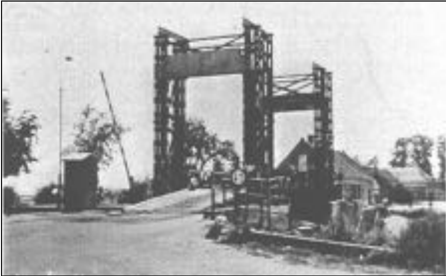
Spandau Bridge Sluis 11 Someren, van begin 1945 tot juni 1946.