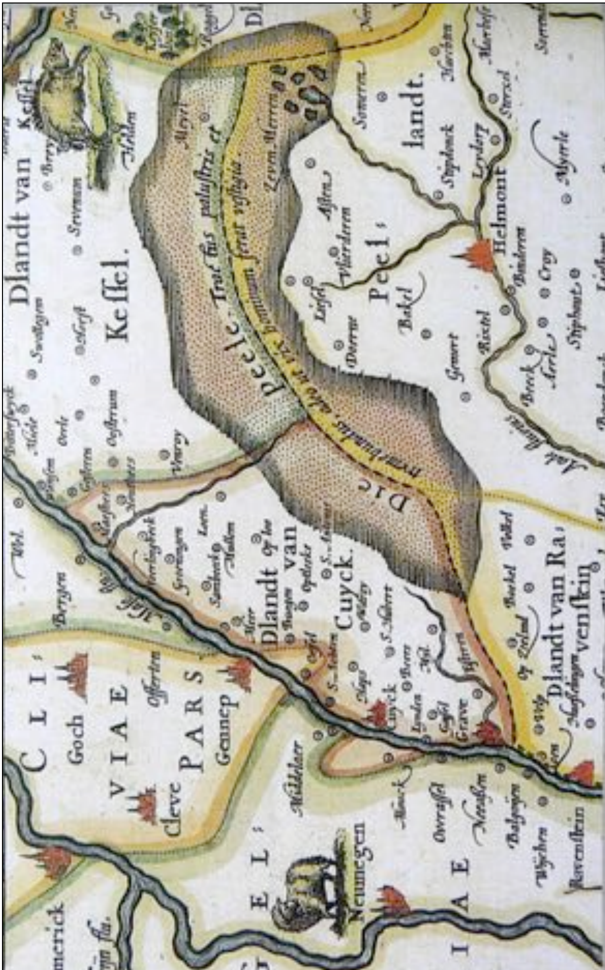
Kaart van de Peel uit 1617 van P vd Keere (let op de zeven meren)