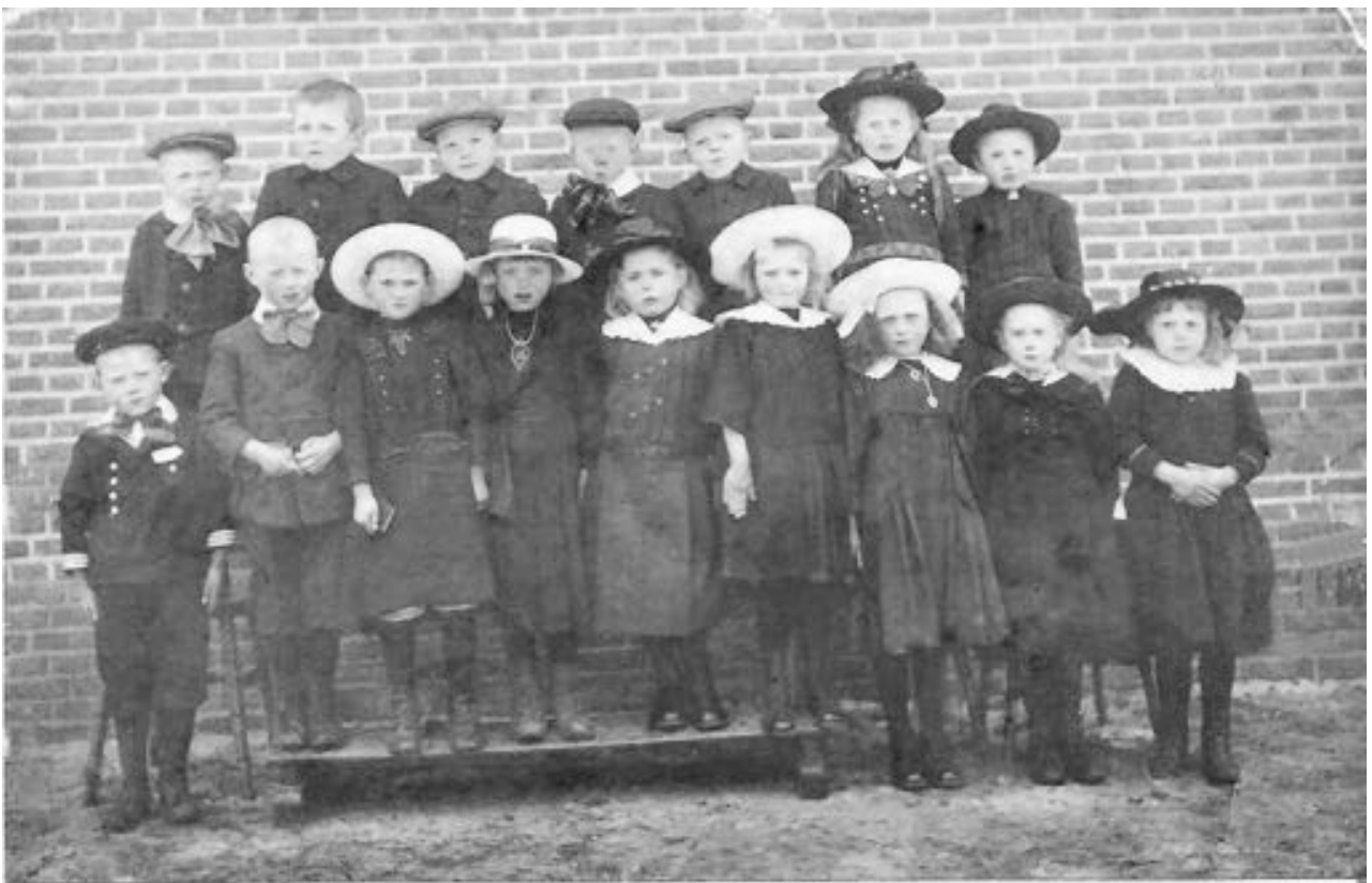
Foto uit 1922 van de eerste 1e communie uit de parochie H. Antonius van Padua te Heusden. ( namen van de communicanten zie pagina 4 )