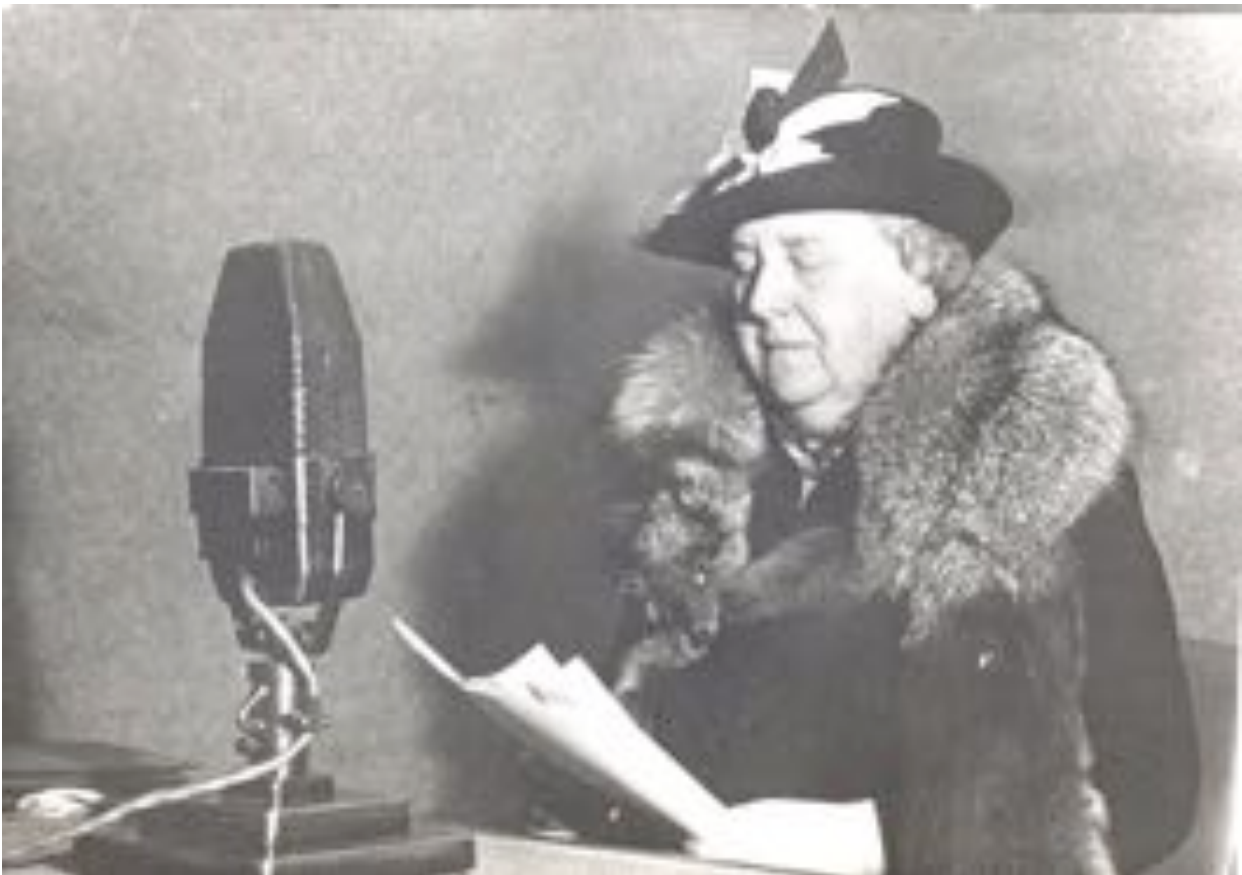
foto: Koningin Wilhelmina voor radio Oranje

Ontelbaar waren de moppen over Adolf en Benito, over Stalin, Hitler en Chamberlain. Ook openlijk werd er met Duitsland de spot gedreven en actie gevoerd voor 't Oranjehuis'. Vooral de luisteraars naar de Engelse radio werden voortdurend daardoor aange- vuurd.