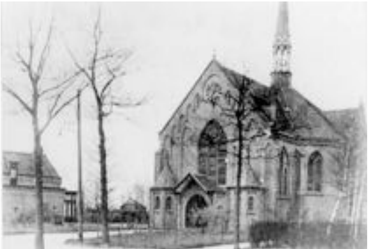
Parochiekerk H. Antonius van Padua te Heusden