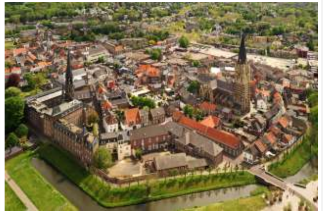
22 juni > Sittard