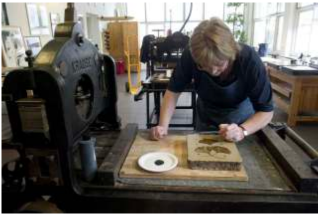
25 mei > Steendrukmuseum