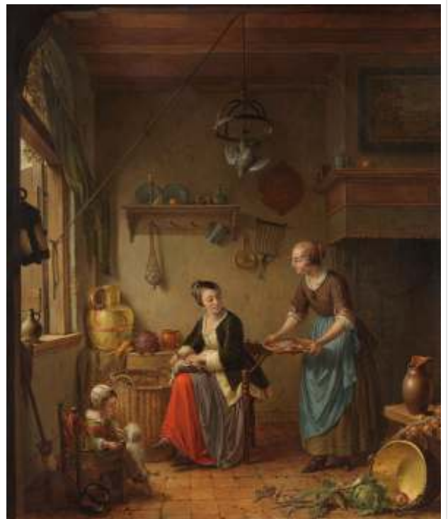
11 december > Eetcultuur