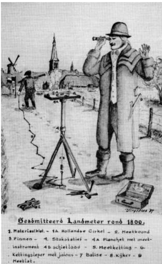
Geadmiteerde Landmeter rond 1800.