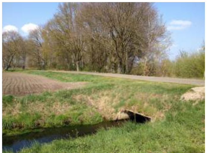
Afb. 3 Duiker Eeuwselse Loop onder Korhoenweg.

Bij dit riviertje/beekje stond toen nog geen naam vermeld maar tegenwoordig is dat de Eeuwselse loop. In 1832 zou hier een brugje gelegen kunnen hebben maar tegenwoordig is dat een betonnen duiker onder de Korhoenweg (afbeelding 3). Tussen de hoge bomen loopt nu het zandpad Heikamperweg wat in 1832 ook al bestond.