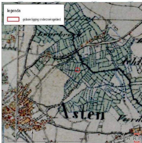
*Het onderzoeksgebied globaal geprojecteerd op de topografische kaart van ca. 1850.

In opdracht van de gemeente Asten heeft RAAP van 14 mei tot en met 18 mei 2018 een archeologische opgraving uitgevoerd in plangebied Asten Loverbosch - Fase 2. In de loop van 2016 en 2017 werden hier door detectoramateur Luc Pansters 23 fragmenten van zilveren Romeinse munten gedetecteerd.