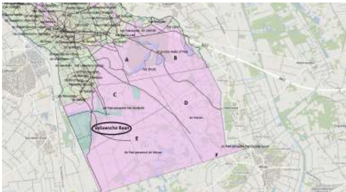
Afb. 4 Deelgebieden van de Peel met de Veluwsche Baan in 1832

Gebied F de Peel genaamd het Eeuwig Leven