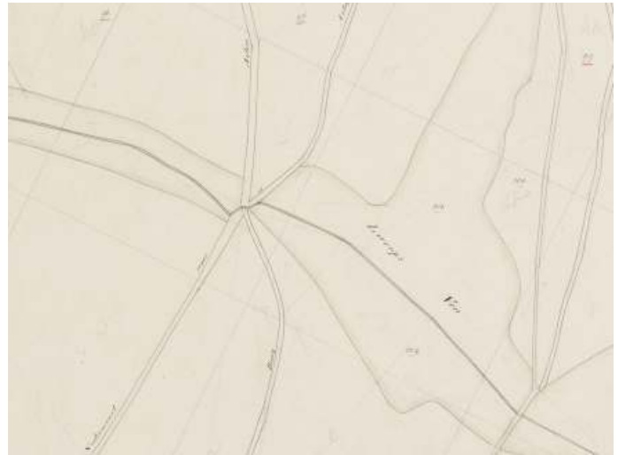
Afb. 2 Detail kadasterkaart 1832 sectie D blad 4

In de linker bovenhoek bij punt A is te zien dat de toenmalige wegen op één locatie het riviertje kruisen. Op de kadasterkaart van afbeelding 2 is dat nog wat duidelijker te zien.