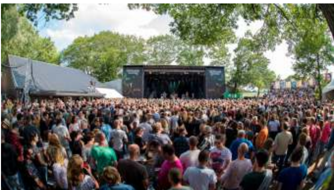
Afb. 2 NirwanaTuinfeest

Dat Nirwana Tuinfeest zou uiteindelijk de kurk worden waar Nirwana op drijft. Dat feest kan de boeken in als het oudste en mooiste driedaagse popfestival in de regio. Geen band die daar niet op het podium gestaan wil hebben!