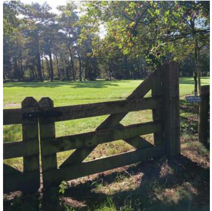
Afb. 5 Hekje langs zandpad tussen Gezandebaan en Korhoenweg

kruisje op afbeelding 1 markeert 2 houten hekjes langs het fietspad tussen de Gezandebaan en de Korhoenweg. In het verlengde van het meest zuidelijke hekje, afbeelding 5, is aan de overzijde van de baan een opening te zien in de groenstrook. Dat is nog een restant van de oorspronkelijke Veluwsche Baan. Op afbeelding 6 is dit nog wat uitvergroot en op afbeelding 7 de locatie waar het pad het golfcomplex verlaat en langs camping de Peelpoort richting Gezandebaan loopt.