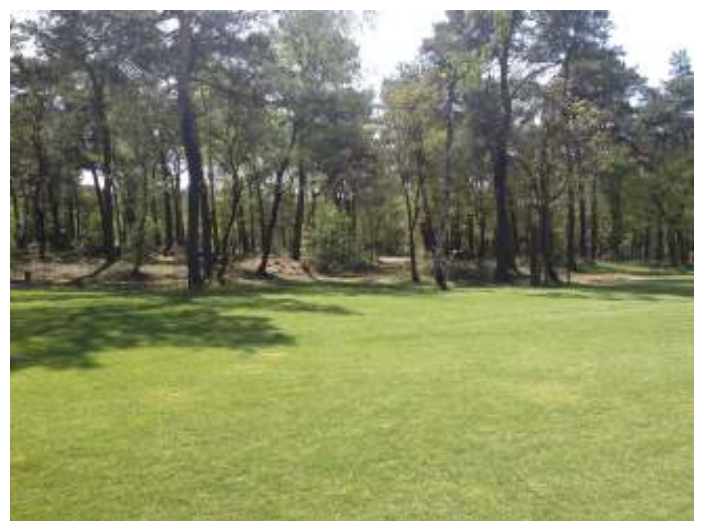
Afb. 6 Pad tussen hole 2 en hole 18 op golfbaan