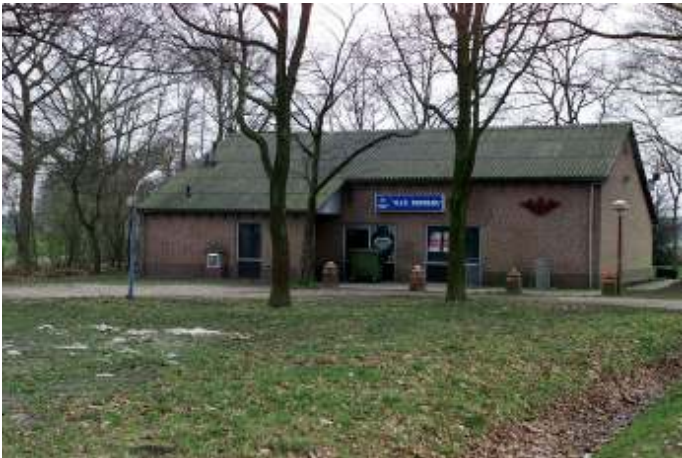
Afb 1 Nirwana aan de Meervensedijk4

mensen van het eerste uur de discussieavonden over allerlei thema's, de politieke avonden en de filmavonden. Minder ambitieuze ontspanning mocht ook; Nirwana had niet voor niets een tapvergunning.