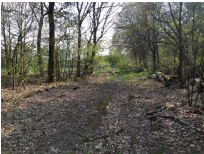
Afb. 7 Bospad op golfterrein tussen hole 18 en aangliggend bosgebied langs camping de Peelpoort

Zuidelijk van de Gezandebaan zijn geen sporen meer ontdekt van de oorspronkelijke Veluwsche Baan.