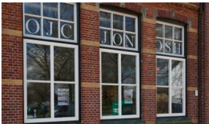
Afb 4 Jonosh in oude Mariaschool

Halverwege de jaren zeventig verhuisde Jonosh naar de twee voormalige kleuterlokalen bij de vroegere meisjesschool aan het Vorstermansplein. Daar waren op een bescheiden podium ineens iets grotere concerten mogelijk en was door de week ook ruimte om er te pingpongen.