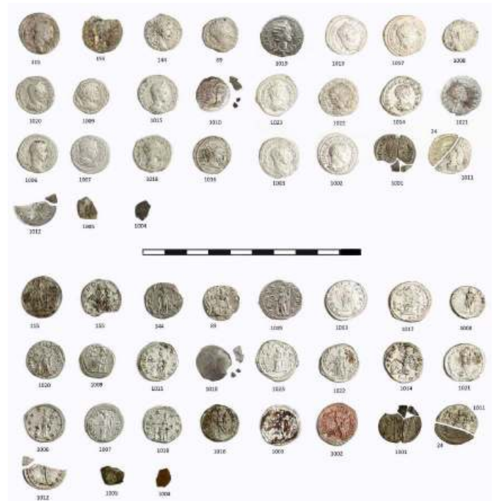
*Voor- en keerzijden van de Romeinse zilvermunten van Asten.

de laagte. Zowel de grondsporen als vondsten kunnen in verband gebracht worden met de post-middeleeuwse ontginnings- en landbouwkundige activiteiten.